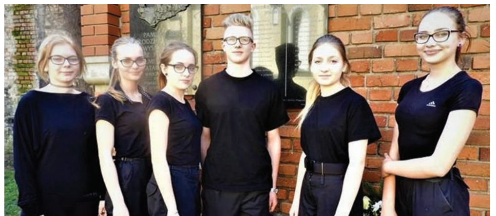
Uczniowie ZSP nr 2 w Jarocinie biorący udział w konkursie.

Reprezentacja Zespołu Szkół Ponadgimnazjalnych nr 2 w Jarocinie znalazła się w gronie 12 laureatów II edycji konkursu „Policjanci w służbie historii”. W nagrodę uczennice, których praca została wyróżniona, pojadą na wyjazd edukacyjny na Litwę, Łotwę i do Rosji.