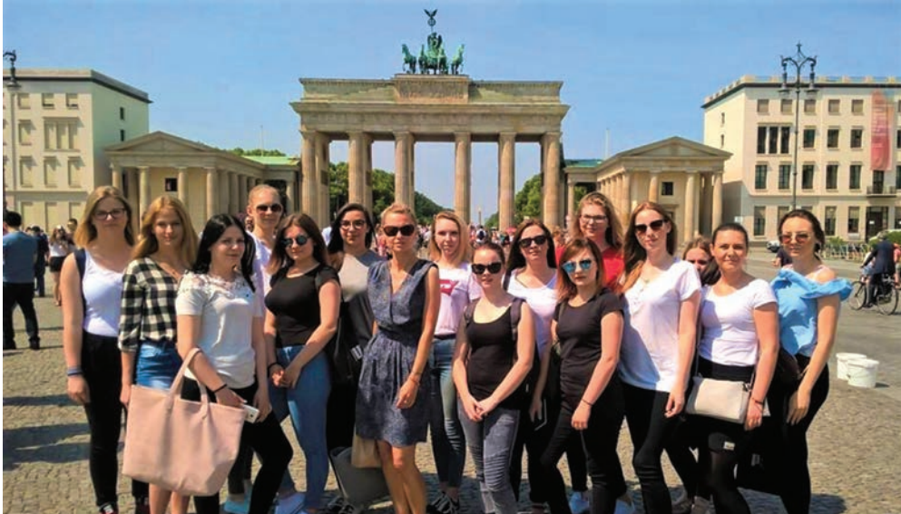
Jarocińskie fryzjerki, podczas praktyk w Berlinie.

15 uczennic z technikum usług fryzjerskich znajdującego się przy Zespole Szkół Ponadgimnazjalnych nr 2 w Jarocinie odbyło dwutygodniowe praktyki zawodowe w Berlinie w ramach projektu „Nożyczkami przez Europę”. Na ten cel szkoła pozyskała ponad 225 tysięcy złotych dotacji.