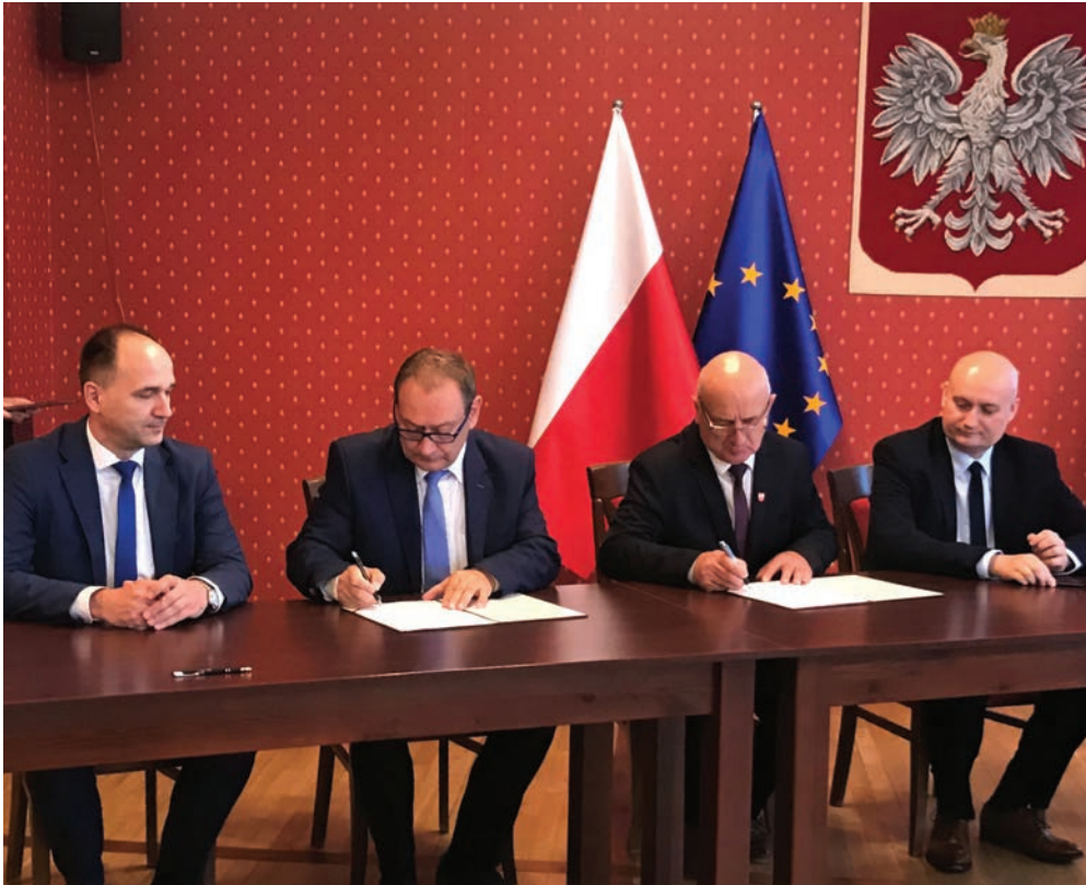
Moment podpisania umowy ws. sfinansowania remontu drogi Golina - Zakrzew.

W Poznaniu w obecności Wojewody Wielkopolskiego Zbigniewa Hoffmanna oraz Starosty Jarocińskiego Teodora Grobelnego i Wicestarosty Mirosława Drzazgi - została podpisana umowa w ramach „Programu Gminnej i Powiatowej Infrastruktury Drogowej na lata 2016 - 2019”.