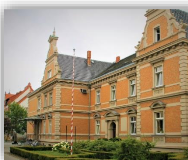
Starostwo Powiatowe w Jarocinie, Al. Niepodległości 10-12, 63-200 Jarocin

Siedziba Starostwa mieści się w trzech budynkach zlokalizowanych na terenie Jarocina. Budynek główny zlokalizowany jest przy al. Niepodległości 10-12 w Jarocinie, w którym urzędują władze Powiatu oraz mieszczą się wydziały, referaty i samodzielne stanowiska takie jak: Wydział Administracyjno-Inwestycyjny w tym: Referat Organizacyjny, Zamówień Publicznych i Inwestycji, Referat Komunikacji i Dróg, Referat Budownictwa i Środowiska, Wydział Finansów, Wydział Oświaty i Spraw Społecznych, Pion Ochrony Informacji Niejawnych, Biuro Radców Prawnych, Powiatowy Rzecznik Konsumentów, Biuro ds. Informatyki, Biuro ds. Kontroli, Inspektor Ochrony Danych, Biuro Rady, Stanowisko ds. Zarządu, Punkt Nieodpłatnej Pomocy Prawnej. W budynku Starostwa przy ulicy Zacisznej 2 w Jarocinie zlokalizowany jest Referat Komunikacji i Dróg Powiatowych oraz w budynku przy Kościuszki 10 w Jarocinie funkcjonuje Wydział Geodezji i Gospodarki Nieruchomościami oraz Geodeta Powiatowy.