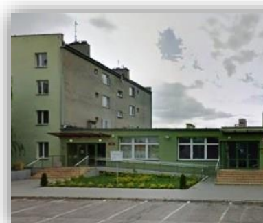
Referat Komunikacji i Dróg Powiatowych, ul. Zaciszna 2a, 63-200 Jarocin